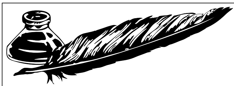
Figur 2: Tegning laget med Adobe Illustrator

Advarsel! Enkelte bruker voldsomt mye tid og krefter på å prøve å tvinge \LaTeX til å plassere en figur eller tabell et fast sted i dokumentet, for eksempel slik at de kan skrive «... som vi ser i følgende figur:». Slikt blir sjelden vellykket! La heller \LaTeX få bestemme hvor flytende figurer og tabeller bør plasseres og bruk kryssreferansemekanismen til å referere til den.